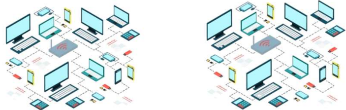
Hình 2: Không gian này có thể được sử dụng để bao gồm một biểu đồ, hình ảnh, hoặc bảng để cung cấp thêm thông tin.

Việc trình bày kết quả một cách rõ ràng và súc tích là rất quan trọng. Kết quả có thể được trình bày bằng bảng, biểu đồ, đồ thị hoặc bất kỳ loại hình hỗ trợ trực quan nào khác. Thêm các giải thích ngắn gọn bằng văn bản vào hình ảnh để minh họa cho những phát hiện quan trọng. Xin nhắc lại rằng trong khi hình ảnh cung cấp bằng chứng hỗ trợ, văn bản phải tóm tắt những phát hiện quan trọng nhất.